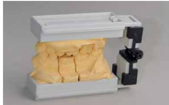
Abb. 31 und 32: Eine alternative Abformtechnik ist die Doppelbissabformung mit Polyäther.