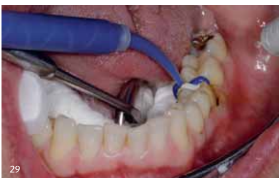
Abb. 27 bis 29: Retraktion mit der 2-Faden-Technik: Aufwändiges Set-up zur Trockenhaltung vor der Unterkieferabformung, die bei Polyätherabformungen notwendig ist.