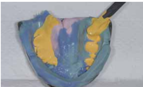
Abb. 35: Ausgießen der Abformung

[1] Miller PD: Persönliche Mitteilungen, 3F Kurs, Praxis Diemer 2001.