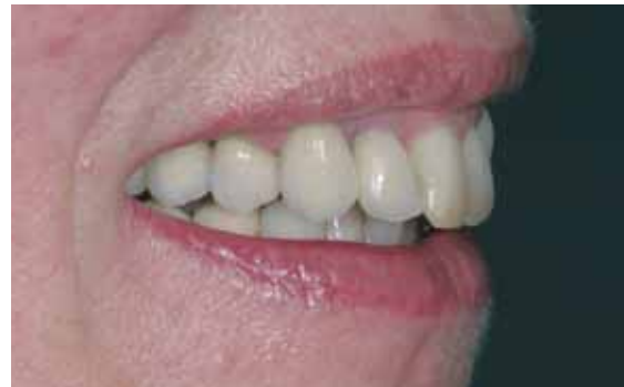
Abb. 18 und 19: Reizlose, gesunde Situation der marginalen Gingiva zirka drei Wochen nach der Präparation und Abformung. Deutlich ist der Einfluss des Provisoriums zur Ausformung der Gingiva zu sehen.

aus der irreversibel elastischen Gruppe sind in dieser Hinsicht klar im Nachteil. Abformungen sollten zur Herstellung mehrerer identischer Modellstümpfe mehrfach ausgießbar sein, Polyäther und alle anderen irreversibel elastischen Materialien sind dafür ideal geeignet. Bei Hydrokolloid sind dafür mehrere Abformungen notwendig.