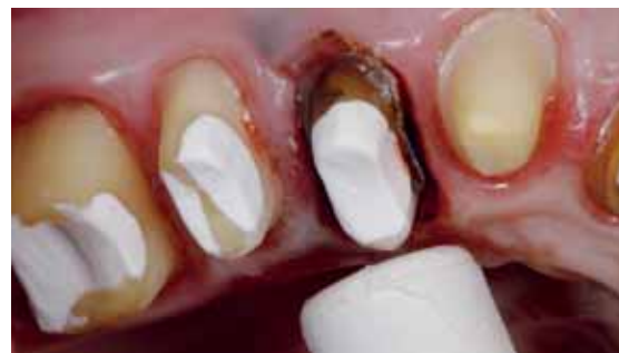
Abb. 1 und 2: Einsatz der Radiochirurgie: Die dünne Elektrode, deren Arbeitssende durch eine Kunststoffschutzhülle beliebig lang einstellbar ist, wird im Sinne einer internen Gingivektomie unterhalb der Präp Grenze im Sulkus geführt. Eine massive, anhaltende Touchierung der Wurzeloberfläche soll vermieden werden.