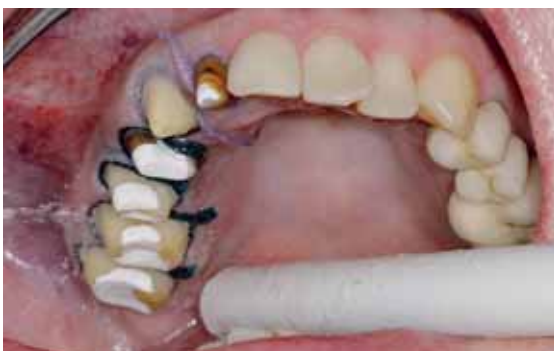
Abb. 14: Bevor die Fäden entfernt werden, muss gründlich abgesprayt werden.