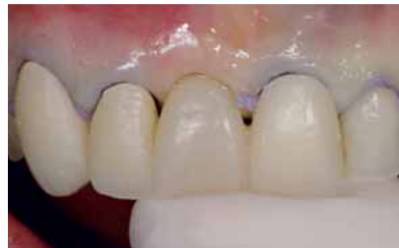
Abb. 12 und 13: Zur Fadenfixierung und Stabilisierung des Ponticbereiches kann das eventuell vorhandene Provisorium genutzt werden.