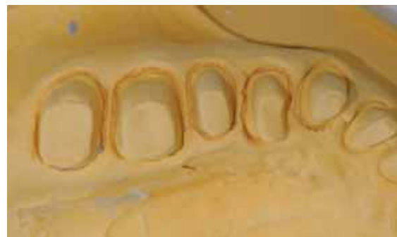
Abb. 36: Detail der Modellsituation