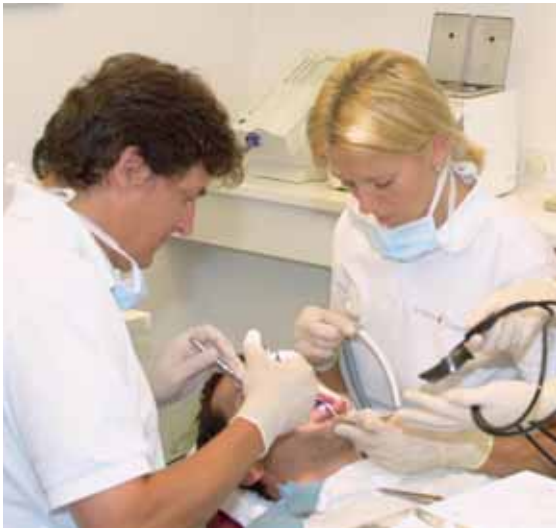
Abb. 25: Behandlungssituation bei Hydrokolloid-Abformung