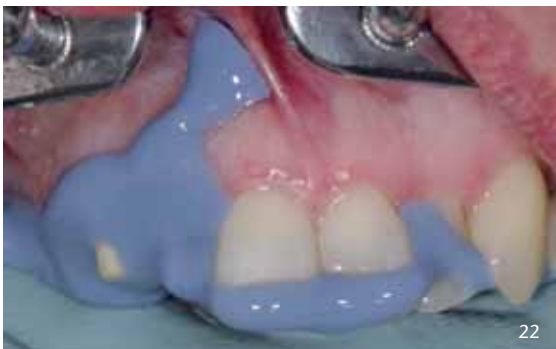
Abb. 20 bis 22: Beim Absetzen des Spritzenmaterials muss man unbedingt im Vestibulum beginnen, da durch Erkalten oft eine harte Stelle im Material vorliegt, die nicht gut zeichnet. Die Präparationen und der komplette Zahnbogen werden dann vollständig mit Hydrokolloid überspritzt, bevor der Löffel eingesetzt wird. Hierbei muss zügig gearbeitet werden, damit das vorgespritzte Hydrokolloid nicht anfängt zu gelieren.

Trocknung vor der Abformung gar nicht notwendig ist. Abformungen über mehrere präparierte Zähne vor allem im Unterkiefer-Seitenzahnbereich sind reproduzierbar wohl nur mit Hydrokolloid machbar (Abb. 20 bis 22). Bewährt hat sich bei uns die routinemäßige Anfertigung von zwei offensichtlich gleichwertigen Abformungen (Abb. 23 bis 25). Aus einer wird ein Sägemodell hergestellt, die zweite, womöglich etwas schlechtere, bleibt ungesägt und dient der genauen Approximalkontaktpunktgestaltung, womit das klinisch umständliche Einpassen der Kontaktpunkte praktisch entfällt.