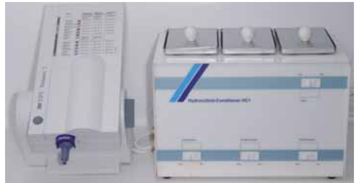
Abb. 26: Mit dem links abgebildeten Pentamix 2 kann Polyäther hervorragend gemischt werden. Der Hydrokolloid-Conditioner HC1 (rechts) bereitet das Hydrokolloid für den Einsatz vor.