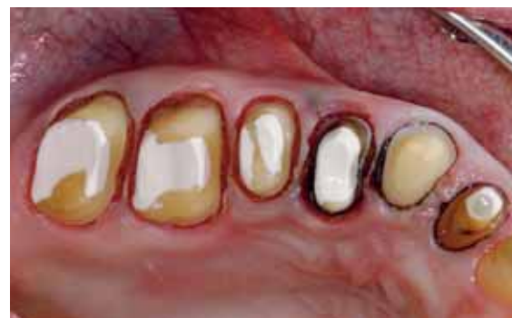
Abb. 15: So stellt sich die Situation direkt vor der Abformung dar. Wichtig: Nur was man jetzt sieht, kann auch abgeformt werden. An den Frontzähnen verbleibt der erste Faden.