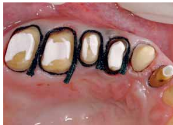
Abb. 8: An den Seitenzähnen wird ein Z-Twist Epinephrin Faden eingebracht.

Ein feuchtigkeitstolerantes Material wie Hydrokolloid hat im feuchten Mundmilieu Vorteile. Materialien