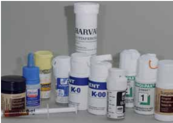
Abb. 6: Unser Sortiment an Retraktions- fäden und blutstillenden, adstringieren- den Lösungen

tenteste ist sicher das Epinephrin. Es ist in vorimprägnierten Fäden erhältlich oder als Flüssigkeit, mit der nach eigenem Ermessen Fäden getränkt werden oder die Gingiva direkt benetzt wird. Man sollte sich über die kardiovaskulären Wirkungen des Mittels klar sein. Eine leichte Tachykardie ist zu erwarten. Auch werden Aluminium-Chlorid, -Sulfat oder Eisensulfat in den unterschiedlichsten Darreichungsformen angeboten. Orbat als Mittel aus der Hals-Nasen-Ohren-Medizin bewirkt vor allem in Verbindung mit der 2-Faden-Technik eine suffiziente Hämostase.