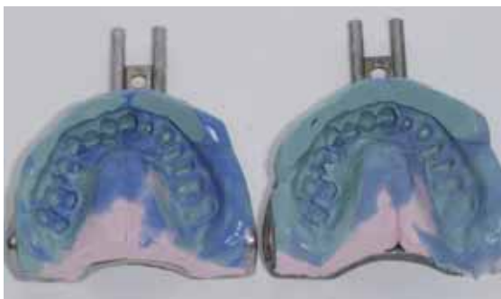
Abb. 23: Routinemäßig nehmen wir immer zwei Abformungen ab.

Trocknung vor der Abformung gar nicht notwendig ist. Abformungen über mehrere präparierte Zähne vor allem im Unterkiefer-Seitenzahnbereich sind reproduzierbar wohl nur mit Hydrokolloid machbar (Abb. 20 bis 22). Bewährt hat sich bei uns die routinemäßige Anfertigung von zwei offensichtlich gleichwertigen Abformungen (Abb. 23 bis 25). Aus einer wird ein Sägemodell hergestellt, die zweite, womöglich etwas schlechtere, bleibt ungesägt und dient der genauen Approximalkontaktpunktgestaltung, womit das klinisch umständliche Einpassen der Kontaktpunkte praktisch entfällt.