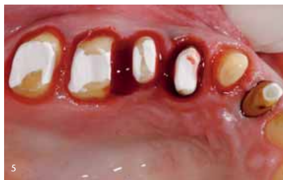
Abb. 3 bis 5: Im Sinne des Anwendungsprotokolls von Mutschelknaus wird mit einem Carver oder einem Scaler vorsichtig die oberflächliche Nekroseschicht abgeschabt und mit H_2O_2 gesäubert. Jetzt kann es wieder zu einer Blutung im Sulkus kommen.

bereich eher in der Dimension 2, abhängig von der Gingivasituation. In der Regel kommt die 1-Faden-Technik zum Zuge (Abb. 8).