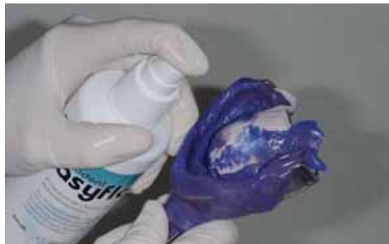
Abb. 33 und 34: Ausspülen der Abformung mit gebremstem Wasserstrahl und Konditionierung der Oberfläche mit Entspannungsmittel vor dem Ausgipsen

Okkludatoren ist es eine zeitsparende, aber trotzdem präzise Methode, um einzelne Restaurationen im Seitenzahnggebiet herzustellen. Mit Hilfe eines speziellen Abformträgers, dem Quadrant Tray von Safident, werden beide Kiefernhälften mit der Doppelmischtechnik gleichzeitig abgeformt und die Kieferrelation habituell fixiert. Die Ober- und Unterkieferhälfte sind durch eine mikrodünne PE-Folie getrennt, dadurch wird suffizient ein Ineinanderfließen des Abformmaterials respektive des Modellgipses verhindert. Abformmaterial der Wahl hierbei ist Polyäther.