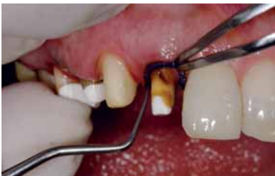
Abb. 7: Einbringen des ersten mit Orbat getränkten Fadens an den nicht durch Radiochirurgie dargestellten Präp Grenzen der Frontzähne. Die Fadenenden sollen sich nicht überlappen, sondern genau miteinander abschließen.

Nach Einbringen der Fäden ist es wichtig, dass sie über die ganze Einwirkdauer genau in situ bleiben. Sowohl die Ultradent-Fäden wie auch die Z-Twist haben allein durch ihr Konstruktionsprinzip gute Voraussetzungen. Zusätzlich sollte aber eine Art Druckverband oder Fixierungsmittel appliziert werden. Für Hydroanwender eignet sich auch eine Lage Spritzenmaterial, die über die Fäden gespritzt wird. Alternativ kann sowohl bei Hydro wie auch bei allen anderen Materialien erwärmte Gutta-percha verwendet werden. Dabei wird das provi-