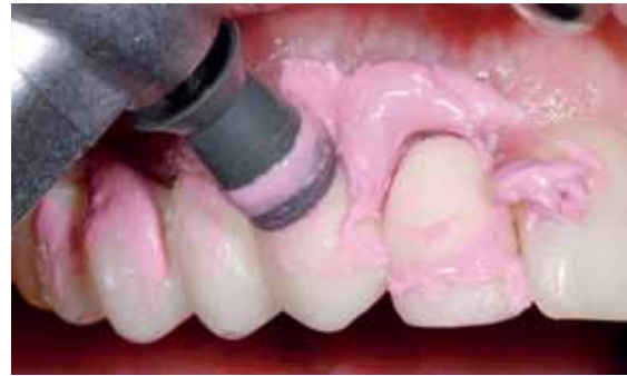
Abb. 16 und 17: Für die Ausheilung der traumatisierten marginalen Gingiva ist neben dem exakt passenden Provisorium die akribische Zemententfernung und Politur nach der Zementierung der Provisorien essenziell.