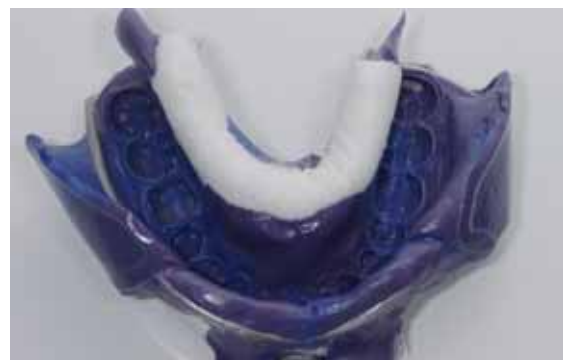
Abb. 30: Die Parotisrolle verbleibt während des Aushärtens in situ und hält dadurch suffizient den Mundboden ab.

Eine interessante Variante ist die Doppelbiss-Technik (Abb. 31 und 32). In Verbindung mit kleinen