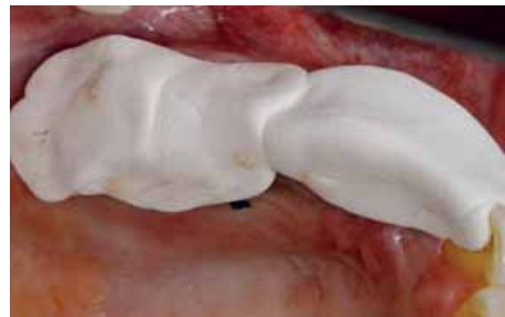
Abb. 10 und 11: Die erwärmte Guttapercha wird eingepresst und fixiert die Fäden in situ.