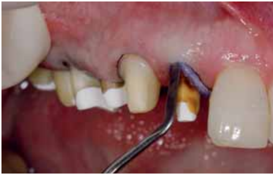
Abb. 9: An den Frontzähnen wird ein zweiter, verdrängender Orbat-Faden eingebracht. Dieser Faden wird zur leichteren Entfernbarkeit länger gelassen und kann so mit der Pinzette leichter gepackt werden. Die Unterscheidung sowohl mit verschiedenen Fäden wie auch mit verschiedenen Retraktionsmedien zu arbeiten, liegt an der Unterschiedlichkeit der Gewebe. Zahnfleisch im anterioren Bereich reagiert viel sensibler auf Traumatisierungen, deshalb wird in diesem Bereich sehr schonend vorgegangen. Es gilt zwischen absolut exakter Darstellung der Präparationsgrenze und Gewebeschonung einen Mittelweg zu finden.