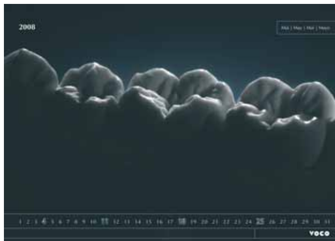
Impressionen des VOCO-Kalenders

Die weltweit größte Kalenderpräsentation gehört zu den bedeutendsten Wettbewerben der Druck- und Medienbranche und zeigt einen repräsentativen Querschnitt des aktuellen Kalenderschaffens. Sie wird gemeinsam vom Verband Druck und Medien in Baden-Württemberg e.V., dem Graphischen Klub Stuttgart e.V., der Kodak GmbH und dem Wirtschaftsministerium des Landes Baden-Württemberg veranstaltet. Ziel dieser Präsentation ist es, Fachleuten und der interessierten Öffentlichkeit die unterschiedlichen Dimensionen dieses Mediums vor Augen zu führen und zur Reflexion des Kalenders in unserer Zeit anzuregen. Der Kodak-Fotokalenderpreis setzt zudem Maßstäbe in der Bewertung zeitgenössischer Fotografie. Die höchste Auszeichnung dieses Wettbewerbs, der Gregor-Award, gilt als der „Oscar“ der Druck- und Medienbranche. Die prämierten Kalender zeichnen sich durch gelungene Marketingkonzeptionen, interessante Gestaltungskonzepte, hochwertige Produktion und Materialauswahl, Funktionalität und Gebrauchswert, brillante Fotografie, neue Sehweisen, Kreativität und Originalität aus.