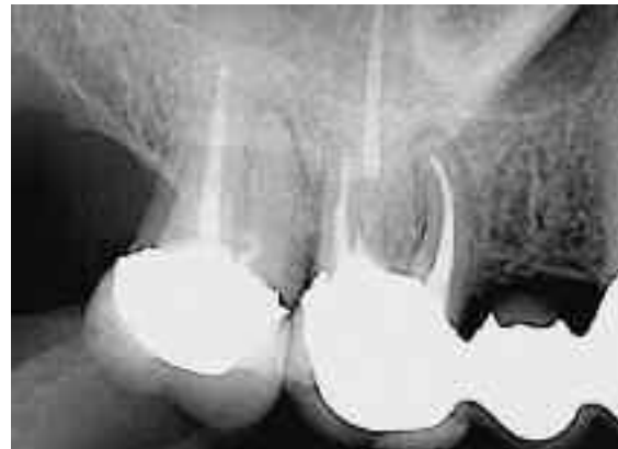
Abb. 14: Abschlussituation im Röntgenbild nach Perforationsdeckung und Obturation der vier Wurzelkanalsysteme

Während der Wurzelkanalaufbereitung sollte auf den übertriebenen Einsatz sehr großer und/oder steifer Instrumente verzichtet werden. Dies gilt insbesondere für Gates-Glidden Bohrer. Bei gekrümmten Kanälen haben sich flexible, rotierende Nickel-Titan-Instrumente zur Vermeidung einer apikalen Perforation bewährt. Besondere Vorsicht muss während der Präparation für einen Wurzelstift gelten, besonders in distalen Wurzeln unterer Molaren besteht ein erhöhtes Perforationsrisiko. Kvinnsland et al. beobachteten in ihrer Untersuchung, dass 50 Prozent der Perforationen während einer Stiftbohrung auftraten [10].