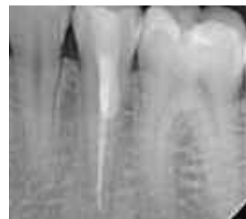
Abb. 16: Röntgenbild nach Perforationsdeckung im mittleren Wurzel Drittel und Wurzelkanalfüllung des Zahnes 35. Es musste kein Widerlager verwendet werden.