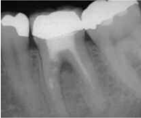
Abb. 4: Strip-Perforation bei einem Unterkiefermolar, die durch den übertriebenen Einsatz eines Gates-Glidden Bohrers entstanden ist. Interradikulär imponiert bereits eine Aufhellung.

ein häufiger Grund für eine Via falsa im mittleren Wurzel Drittel. Darüber hinaus ereignen sich hier Perforationen im Rahmen der Revision von insuffizienten Wurzelkanalfüllungen (Abb. 5), dem Versuch der Entfernung frakturierter Instrumente und infolge nicht adäquat durchgeführter Stiftbohrungen für postendodontische Restaurationen (Abb. 6) [10].