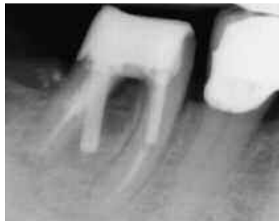
Abb. 6: Großflächige Perforation durch eine nicht adäquat durchgeführte Stiftbohrung

Röntgenbilder der Wurzelregion in verschiedenen exzentrischen Angulationen, ebenso wie Bissflügel-aufnahmen, können für eine korrekte Diagnose-