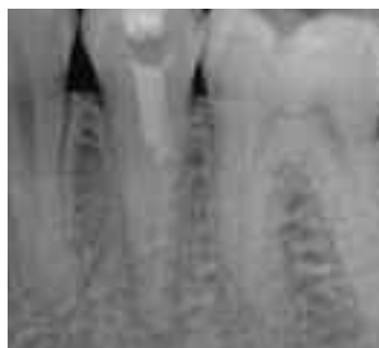
Abb. 15: Röntgenbild regio 34 bis 36. Es besteht der Verdacht einer Perforation im mittleren Wurzel Drittel des Zahnes 35 beim Trepanationsversuch des Zahnes alio loco.

Die Abbildungen 9 bis 14 wurden freundlicherweise von Dr. Jörg Schröder (Berlin) zur Verfügung gestellt.