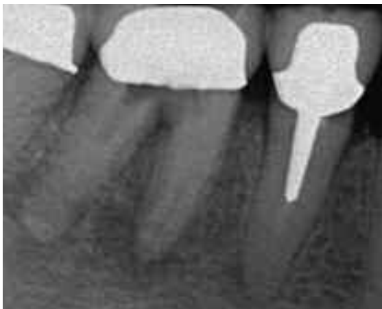
Abb. 1: Perforation im Furkationsbereich eines Molaren im Unterkiefer beim Anlegen der Zugangskavität

Unbeabsichtigte Zahn- beziehungsweise Wurzelperforationen stellen eine artifizielle Verbindung vom Endodont zum Desmodont oder zur Mundhöhle dar. Sie treten bei bis zu 12 Prozent aller endodontischen Maßnahmen auf [4, 11]. Laut Kvinnsland et al. entstehen 53 Prozent aller iatrogenen Perforationen bei der Aufbereitung des Wurzelkanals für einen Wurzelstift. Die verbleibenden 47 Prozent entstehen bei endodontischen Routinearbeitsschritten. Perforationen im Oberkiefer sind dreimal häufiger wie im Unterkiefer [10]. Im Bereich der Krone beziehungsweise