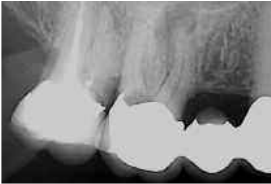
Abb. 9: Radiologische Ausgangssituation einer Perforation im Furkationsbereich eines ersten oberen Molaren

schluss der Zugangskavität dient zur Vermeidung koronaler Undichtigkeiten.