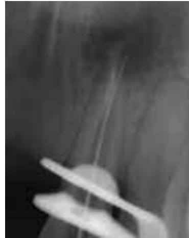
Abb. 5: Apikale Perforation während der Revision einer insuffizienten Wurzelkanalfüllung

Die korrekte Erkennung einer Perforation, ebenso wie deren genaue Lokalisation und die Festlegung eines Behandlungsplanes können sich kompliziert gestalten. Da die Zeitspanne zwischen Entstehung und Verschluss der Perforation einen entscheidenden Einfluss auf die Prognose des Zahnes hat, ist eine zeitnahe und genaue Diagnose von höchster Wichtigkeit. Die Diagnose sollte sowohl durch klinische Beobachtungen inklusive ätiologischer Aspekte als auch röntgenologische Befunde abgesichert werden. Schmerzen und übermäßige Blutung sind die Kardinalsymptome einer intraalveolären Perforation. Der Patient kann bei bereits bestehender, unbehandelter oder insuffizient therapierter Perforation über zumeist dumpfe, pulsierende Beschwerden klagen.