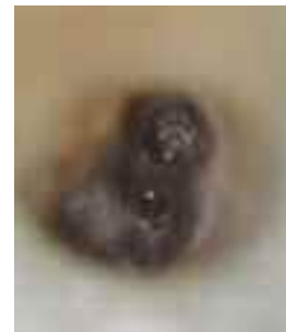
Abb. 3: Der Blick durch das Dentalmikroskop bestätigt den Anfangsverdacht einer labial gelegenen Perforation.

der Furkation treten sie zumeist beim Anlegen der endodontischen Zugangskavität oder bei der Suche nach verlegten Wurzelkanaleingängen auf.