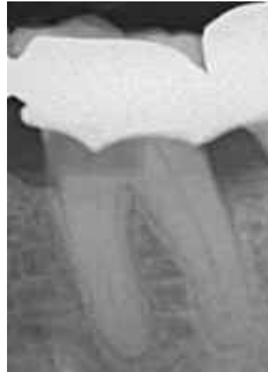
Abb. 7: Perforation eines Molaren bei dem Anlegen der Zugangskavität. Da der Defekt auf Höhe des Limbus alveolaris liegt, sollte MTA („Mineral Trioxide Aggregate“) hier nicht zum Einsatz kommen.

Ungleich schwieriger ist die suffiziente Behandlung von intraalveolären Perforationen. Peeso empfahl bereits Anfang des 20. Jahrhunderts solche Defekte zu füllen. Er erkannte schon damals, dass eine erfolgreiche Behandlung stark von einer frühzeitigen Diagnose, der Immunabwehr des Patienten und dem verwendeten Verschlussmaterial abhängt. Bis Mitte des zwanzigsten Jahrhunderts waren jedoch aufgrund des Fehlens geeigneter Materialien parodontale Entzündungen eine häufige Folge. Die Wahl des Reparaturmaterials ist abhängig von der Zugänglichkeit des zu deckenden Defektes, der Möglichkeit zur (absoluten) Trockenhaltung sowie von ästhetischen Überlegungen. Als bedeutender Parameter für einen Erfolg zählt der möglichst innige Verbund zwischen Zahnhartsubstanz und Restaurationsmaterial.