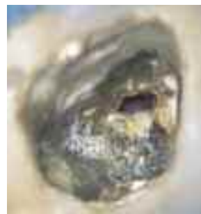
Abb. 10: Klinische Ausgangssituation. Das tatsächliche Ausmaß der Eröffnung ist wegen Rückständen der medikamentösen Einlage nicht vollständig erkennbar.

Um die Komplikation einer Zahnperforation vorab zu vermeiden, sollte während endodontischen sowie restaurativen oder prothetischen Behandlungsschritten besondere Sorgfalt geübt werden. Vor Behandlungsbeginn sollten die Kronen-Wurzel-Ausrichtung