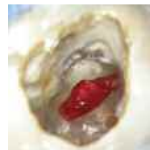
Abb. 12: Aufgrund des ausgeprägten knöchernen Defektes wurde ein resorbierbares Widerlager aus Kollagen eingebracht.