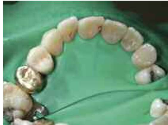
Abb. 1: Kofferdam für eine Frontzahnrestauration von Zahn 16 bis Zahn 24 angelegt