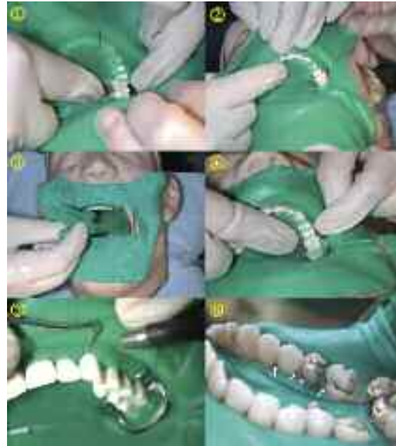
Abb. 3: 1 die Folie wird über die positionierte Klammer gezogen; 2 Durchführen der Kofferdamstege durch die spontan durchgängigen Approximalkontakte; 3 angelegte Frotteeserviette; 4 die vorher belassenen Stege werden mit Zahnseide durch den Kontaktpunkt befördert; 5 zervikales Einrollen; 6 apikalwärtige Papillenverdrängung

Zahnes dargestellt und die Papille apikalwärts verdrängt wird.