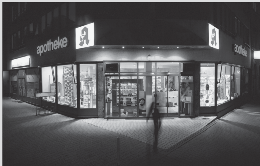
Apotheken sind auch nachts mit ihrem Notdienst für Patienten da.

Wie soll es mit dem Versandhandel von rezeptpflichtigen Arzneimitteln in Deutschland nach dem Urteil des Europäischen Gerichtshofes künftig weitergehen? Nachdem in Deutschland weiterhin die Arzneimittelpreisbindung für hiesige Apotheken gilt, fürchten Apotheker und die Berufsorganisationen der Freien Berufe massive Wettbewerbsnachteile und fordern ein Verbot des Versandhandels. Die Politik ist sich nicht einig.