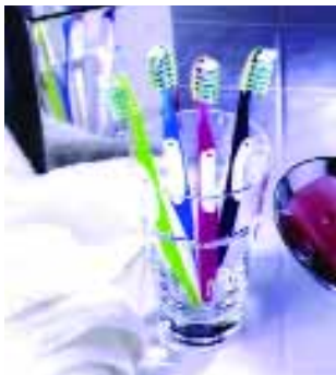
CrossAction Vitalizer – die neue Premium-Zahnbürste mit Massage-Fingern

Mit der neuen Handzahnbürste CrossAction Vitalizer von Oral-B wurde neben einer effizienten Entfernung der Plaque auch die Pflege der Gingiva durch ein zusätzliches Ausstattungselement weiter verbessert. So weist