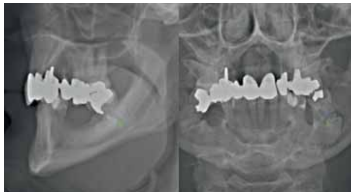
Die Scoutaufnahme dient zur Justierung des Kieferbereichs, in dem die 3D-Aufnahme gemacht werden soll.