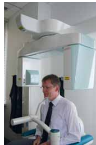
Positionierung des Patienten im DVT