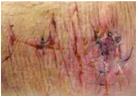
Differentialdiagnostisch muss bei scharfer Gewalt immer an die Möglichkeit einer intendierten Selbstbeibringung gedacht werden.

Der Begriff Strangulation stellt einen Überbegriff für verschiedene Gewalteinwirkungen gegen den Hals dar. Aus einer Gewalteinwirkung gegen den Hals kann einerseits eine Reduzierung der Hirndurchblutung, andererseits eine Verlegung der Atemwege resultieren.