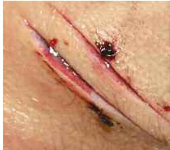
Ein Schnitt entsteht durch Führen eines scharfen Gegenstandes tangential zur Körperoberfläche, sodass eine mehr lange als tiefe Wunde der Haut beziehungsweise der darunterliegenden Strukturen resultiert.

bedingt sind. Hämatome gehen häufig mit Schwellungen einher. Daher ist das Abtasten der behaarten Kopfhaut sinnvoll, um Hämatome abgrenzen zu können.