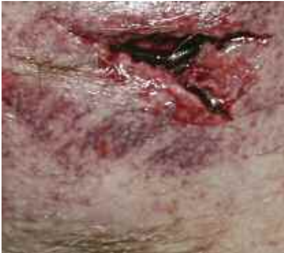
Durch Druck-, Scher- und Zugkräfte kann es zu offenen Hautverletzungen kommen, die aufgrund der kombinierenden Gewalteinwirkung „Quetsch-Riss-Wunde“ genannt werden.