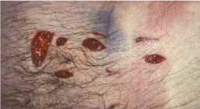
Bei Stichverletzungen ist regelmäßig die Länge der Hautwunde kürzer als die Tiefe des Wundkanals.

fers in das Tatwerkzeug zustande (aktive Abwehr), sie können aber auch Folge einer zum Schutz vor den Körper gehaltenen oberen Extremität sein (passive Abwehr).