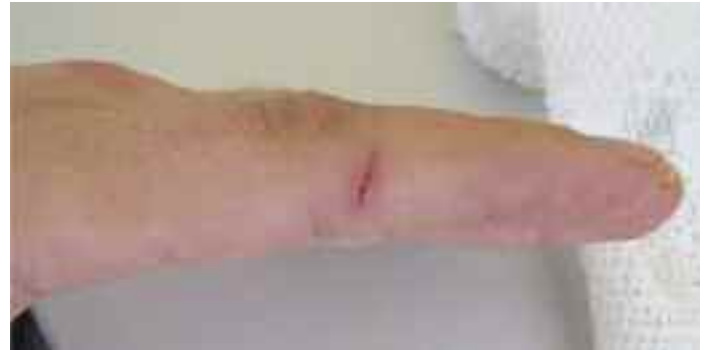
Abwehrverletzungen kommen durch Hineingreifen des Opfers in das Tatwerkzeug zustande (aktive Abwehr), sie können aber auch Folge einer zum Schutz vor den Körper gehaltenen oberen Extremität sein (passive Abwehr).

Als typische Befunde beim Angriff gegen den Hals im Sinne des Würgens werden fleckförmige Hautrötungen, kratzerförmige Hautdefekte und/oder Fingernagelabdrücke am Hals gesehen. Beim Drosseln und Hängen zeichnet sich das verwendete Strangwerkzeug mehr oder weniger gut an der Halshaut ab. Folge einer Gewalteinwirkung gegen den Hals sind sogenannte Stauungsblutungen (Petechien) an Prädilektionsstellen wie Augenlid und -bindehäute, Mundschleimhaut sowie Hinterohrregion.