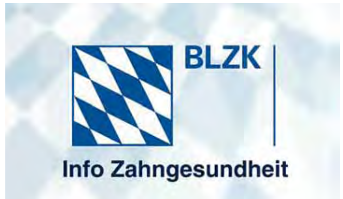
Das neue Nachrichtenformat auf TV-Wartezimmer: BLZK Info Zahngesundheit

Gemeinsam werden monatlich drei Produktionen im Nachrichtenformat – die sogenannten „BLZK Info Zahngesundheit“ – realisiert und im Rahmen des TV-Wartezimmer-Programms ausgestrahlt. Die BLZK hat so die Möglichkeit, Informationen, die für den Patienten wichtig und sinnvoll erscheinen, über das Wartezimmer-Fernsehen zu verbreiten. Die Nachrichten enthalten jeweils drei Meldungen als Bild-Text-Kombination. Die ersten News-Spots waren im September zu sehen. Im Oktober ging es um die richtige Zahnbürste (siehe Abbildung), die Funktionen des Speichels und Zahncreme für Kinder. Themen im November waren Zähne und Schwangerschaft, wie sich Stress auf die Zähne auswirkt und welche Tipps es für die Zahnpflege bei Kindern gibt. Die Kooperationsvereinbarung sieht auch die Produktion von Kurzfilmen zu komplexeren zahnme-