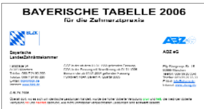
Titelbild der neu erschienenen Bayerischen Tabelle

Die aktuelle Diskussion um die Höhe der Honorierung ärztlicher und zahnärztlicher Leistungen ist längst überfällig. In der Zahnheilkunde war die Entwicklung völlig anders als in der Medizin. Die Gebührenordnung für Zahnärzte ist seit ihrer Einführung 1988 nicht mehr angepasst worden. Das bedeutet: Seit 19 Jahren sind die Honorare für die zahnärztlichen Leistungen auf dem Stand von 1988 stehen geblieben. Inzwischen sind die Praxiskosten aber um mehr als 40 Prozent gestiegen, ohne dass eine Anpassung der Gebühren erfolgte. Sind Patienten, bei denen der Zahnarzt weniger für seine Leistung in Rechnung stellen darf, „Patienten zweiter Klasse“? Dann wären in Zahnarztpraxen inzwischen oft die Privatpatienten, bei denen die GOZ Anwendung findet, „Patienten zweiter Klasse!“.