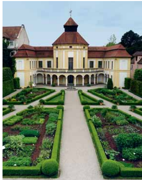
Eine besondere Sehenswürdigkeit des Deutschen Medizinhistorischen Museums in Ingolstadt ist der Arzneipflanzengarten.

Im Eingangsbereich sind die Antike Medizin, die Ausleitenden Verfahren, die religiöse Volksmedizin, die Kinder- und Säuglingspflege und die Hebam-