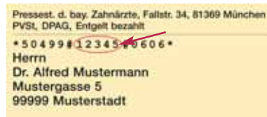
Adressaufkleber des BZB