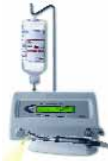
Das neue Chirurgiegerät INTRASurg 1000 von KaVo

Die ebenfalls neuen SONICflex implant Spitzen mit Polymer-Pin ermöglichen eine metallfreie Implantatreinigung ohne die polierten Oberflächen von Implantatthals und Suprakonstruktion aufzurauen.