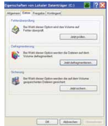
Über „Extras“ wird die Defragmentierung gestartet.

Das Programm überprüft den Zustand der Festplatte, zeigt deren Defragmentierungsgrad an und spricht eine Empfehlung aus, zum Beispiel „Die Festplatte sollte defragmentiert werden“.