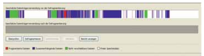
Defragmentierungsgrad einer Festplatte

Das Programm überprüft den Zustand der Festplatte, zeigt deren Defragmentierungsgrad an und spricht eine Empfehlung aus, zum Beispiel „Die Festplatte sollte defragmentiert werden“.