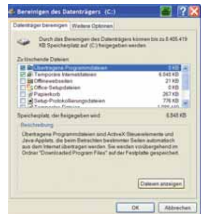
Temp-Dateien löschen und Platz schaffen.

Üblich ist, dass bereits die Option „Temporäre Internetdateien“ ausgewählt ist. Diese Dateien entstehen während der Arbeit am Computer. Im Hintergrund protokolliert das System, auf welchen Seiten sich der Nutzer aufgehalten hat und legt dazu temporäre Internetdateien an. Diese Dateien können im Laufe der Zeit einiges an Festplattenplatz schlucken.