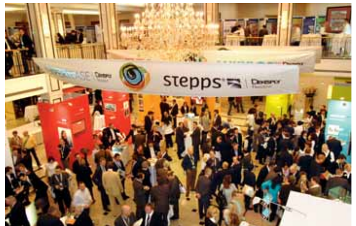
Teilnehmer aus über 60 Nationen waren zum „Familientreffen der Implantologen“ nach Berlin gekommen.