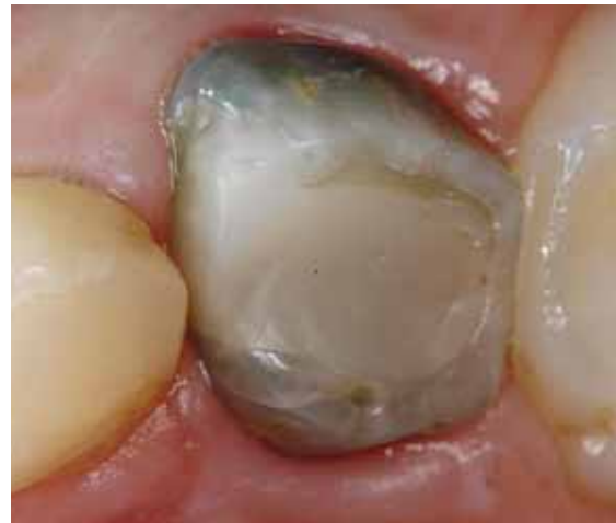
Abb. 5: Die klinische Kontrolle zeigt drei Jahre nach dem Legen der Füllung die deutliche Verfärbung des Zahns 64.

Die Anzahl der klinischen Studien zur Pulpotomie unter Anwendung von MTA ist in den letzten Jahren deutlich gestiegen. Auf der Grundlage der heutigen Daten zeigt MTA klinisch und radiologisch in allen Phasen, bis zur natürlichen Ex-