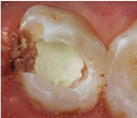
Abb. 3: Am Zahn 64 erfolgte die Abdeckung der Amputationswunde mit white ProRoot. Anschließend wurde das Medikament mit Glasionomerzement abgedeckt und die Kavität adhäsiv verschlossen.