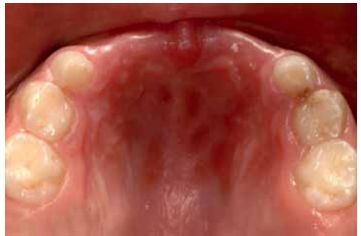
Abb. 2: Bei dem fünfjährigen Mädchen war aufgrund frühkindlicher Karies eine umfangreiche Sanierung indiziert. Unter anderem mussten die Zähne 63 (Pulpektomie) und 64 (Pulpotomie) endodontisch versorgt werden.