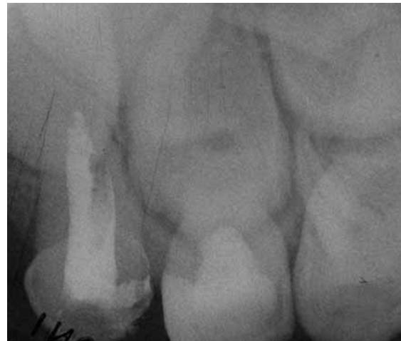
Abb. 4: Röntgenologisch ist am Zahn 64 auch ein Jahr nach der Behandlung das Amputationsmaterial im koronalen Anteil aufgrund des Wismutoxidgehalts gut zu erkennen.

nach Applikation von Mineral Trioxide Aggregate stark verfärben können (siehe Abb. 5). Daher wird momentan versucht, Wismutoxid durch andere röntgenopake Zusätze wie Bariumsulfat oder Pulver aus Gold- beziehungsweise Silberlegierungen zu ersetzen [5], oder auf Zusätze komplett zu verzichten [37].