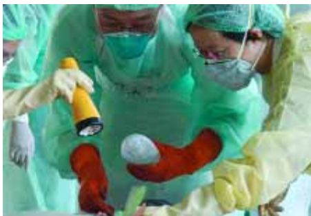
Viele Mitarbeiter zahnärztlicher Fakultäten des Landes halfen mit bei der Identifizierung von Leichen.

Im Tsunami-Gebiet Südthailands erfolgte die Bergung der Opfer rascher als in anderen betroffenen Ländern dank des umfassenden Hilfeinsatzes des Militärs. Die Bergung Toter beinhaltete aber zumeist nicht deren sofortige Zuordnung zu ethnischen Gruppen, und nur in seltensten Fällen war die individuelle Personenerfassung primär möglich. Massengräber und sofortige Feuerbestattungen hätten Angehörigen daheim niemals Gewißheit über das Schicksal ihrer Verwandten und Freunde geben können. Daher waren umfangreiche