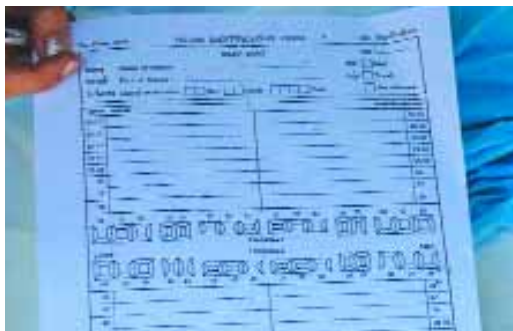
Formular „Victim Identification Form“, in das das individuelle Zahnschema eingetragen wird.

hen dürften. Thailands touristische Optionen aber nur an der vom Tsunami betroffenen Südwestküste zu suchen, käme der Bewertung einer Perlenkette durch Beurteilung einer einzelnen Perle im Schmuckstück gleich. Die Ostküste bietet zahlreiche reizvolle marine Urlaubsziele wie Kho Samui oder Hua Hin – Urlaubsziele für jeden Geschmack und jeden Geldbeutel. Nach Thailand zu reisen, ist heute preisgünstiger denn je beim einladenden Umtauschkurs des Euro. Der hohe Sicherheitsstandard, die Schönheit des Landes und die Freundlichkeit der Bewohner laden zu einem Besuch ein, und der Tourist darf das gute Gefühl pflegen, daß er mit seinem Besuch den Flutopfern des Tsunami hilft. Jeder im Katastrophengebiet ausgegebene Euro fördert dort den Wiederaufbau durch Eigeninitiative,