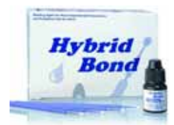
Das neue Hybrid Bond, ein Ein-Flaschen-Adhäsiv-System von J. Morita Europe

Hybrid Bond ist universell einsetzbar für Komposite, Kompomere undOrmocere. Darüber hinaus ist es für die Anwendung bei