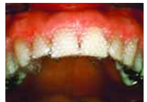
Bleichsystem blend-a-med „Whitestrips Professional“