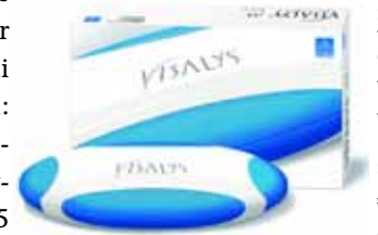
Zahnaufhellung: VISALYS® 7,5 Patienten-Kit für die In-office-/Home-Anwendung

Nach Angaben von: Kettenbach GmbH & Co. KG Im Heerfeld 7 35713 Eschenburg Telefon: 02774/ 705-0 Internet: www.visalys.de E-Mail: info@visalys.de