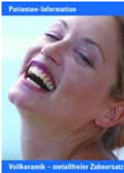
Eine Patienten-Broschüre informiert über „Gut lachen mit Keramikversorgung.“

Die Patienteninformationsbroschüre der VITA Zahnfabrik bietet unter dem Motto „VITA In-Ceram – so individuell wie Ihr Lächeln“ kurze und klare Informationen über Restaurationen aus Vollkeramik.