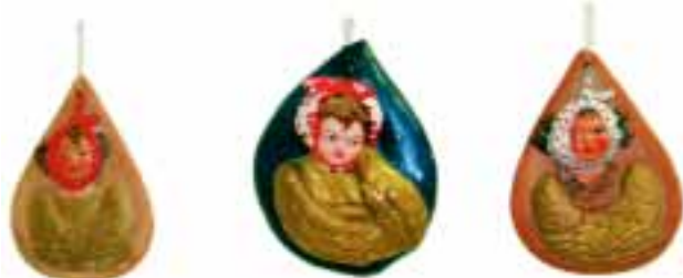
Auch Engel haben Zahnschmerzen: Wandschmuck in der Mallersdorfer Zahnstation