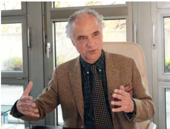
„Wir dürfen nicht aus den Augen verlieren, auch unsere Patienten mitzunehmen auf dem Weg zu einer innovativen und hochwertigen Versorgung.“

BZB: Sie haben von Anfang an kritisiert, dass der Gesundheitsfonds dazu führt, dass auch in der gesetzlichen Krankenversicherung Mittel aus Bayern abfließen, die Ärzten und Zahnärzten bei der Behandlung