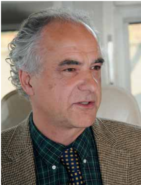
Fazit zum Ende der Amtsperiode: „Wir können uns an unseren Arbeitsergebnissen messen lassen!“

haupt noch erlauben. Da kann ich den Ärger mancher Kollegen gut nachvollziehen.