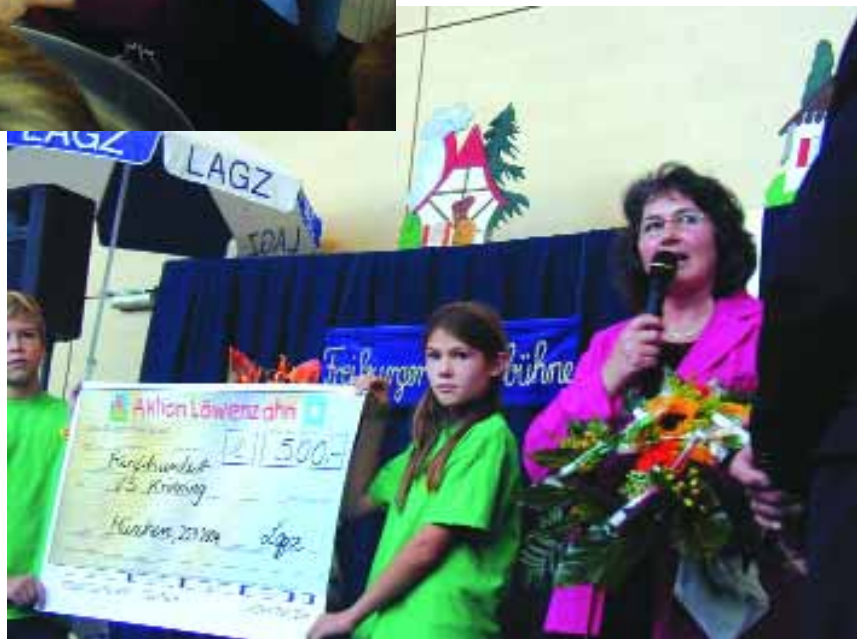
Siegerscheck für die Volksschule Krimming – Hauptgewinner der diesjährigen Aktion Löwenzahn