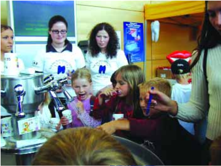
Zähneputzen am Zahnputzbrunnen der LAGZ unter fachkundiger Anleitung von Passauer Zahnärztinnen und deren Helferinnen