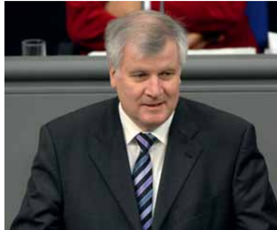
Horst Seehofer, bisher Mitglied des Bundestages, ist Bayerns neuer Ministerpräsident.