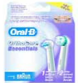
OrthoCare Essentials Aufsteckbürsten-Set von Braun Oral-B

Gillette Gruppe Deutschland GmbH & Co.oHG Geschäftsbereich Braun Oral-B Frankfurter Str. 145 61476 Kronberg im Taunus Telefon: 061 73/ 30-5000 Internet: www.gillette.com/de/homepage.asp