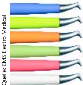
Farbige Air-Flow Handstücke

In blau, gelb, orange, grün, rosé oder weiß präsentieren sich die neuen farbigen Air-Flow Handstücke aus dem Hause EMS frisch und modern. Zudem wurde die Technologie der seit Jahrzehnten bewährten Pulverstrahlgeräte zur Professionellen Zahnreinigung verbessert: Die neu geformte Düse hat eine größere Aktivfläche und ermöglicht dadurch einen gleichmäßigeren Reinigungseffekt als vorher. Eine innovative Düsengeometrie garantiert eine bessere Strömungsführung sowie mehr Betriebssicherheit. In Verbindung mit dem Air-Flow-Pulver sind auch Verstopfungsprobleme passé: Die Free Flow-Technologie sorgt für einen höheren Durchfluss und damit für zuverlässiges, effizientes Arbeiten.