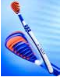
Dr. Best Zungenreiniger – benutzerfreundlich mit Spezial-Lamellen

Mundspül-Lösung zudem den bakteriellen Zahnbelag und hält auch die kariesverursachenden Bakterien in Schach. Das zusätzlich enthaltene Natriumfluorid (250 ppm Fluorid) unterstützt die Remineralisation des Zahnschmelzes und macht die Zähne widerstandsfähiger gegen Karies.