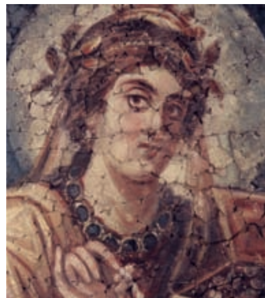
Dame mit Schmuckkasten: Konstantinische Deckenmalerei aus einem Haus unter dem Trierer Dom (Ausschnitt)