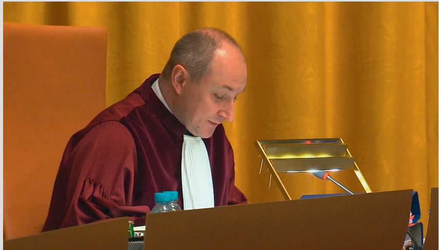
Der Generalanwalt am Europäischen Gerichtshof, Maciej Szpunar .

Fällt der EuGH ein den Schlussanträgen entsprechendes Urteil, fürchtet Schwarz einen weitreichenden Eingriff in das System der Freien Berufe in Deutschland: »Zwar erstreckt sich das