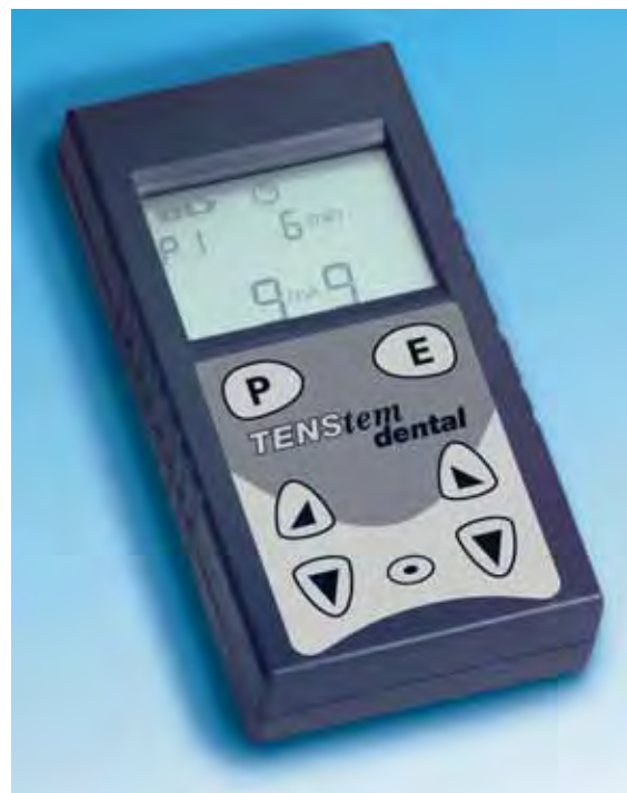
Abb. 2: Moderne TENS-Geräte für die Myozentrik verfügen über eine Balance- und Pausefunktion bis hin zu einer Protokollfunktion zur Kontrolle der erfolgten vorbereitenden Heimanwendungen durch den Patienten.

Damit sich die Ruheschwebe wirklich entspannen kann, darf sie während der TENS-Therapie nicht gleichzeitig als Bereitschaftsposition für eine möglicherweise pathologische Bisslage dienen. Es muss während dieser Zeit etwas zwischen die Zahnreihen gelegt werden, am besten ein Aqualizer [8], der durch die verbundenen Flüssigkeitskammern auch einen symmetrisierenden Ausgleich zwischen der linken und der rechten Kieferhälfte schafft.