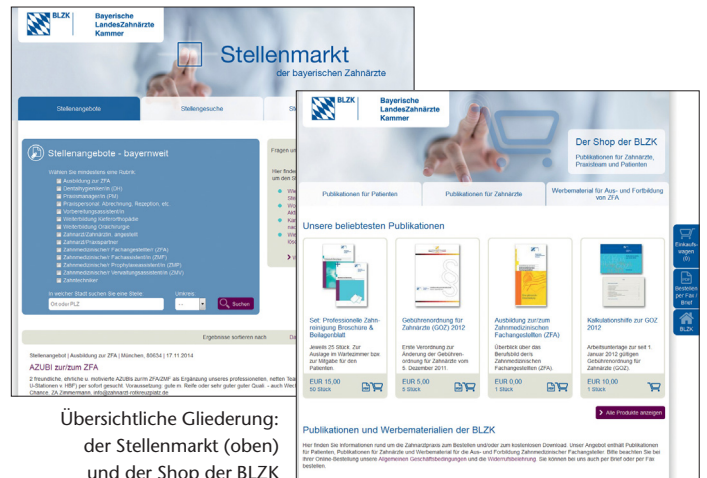
Übersichtliche Gliederung: der Stellenmarkt (oben) und der Shop der BLZK

Der Stellenmarkt der BLZK hält einige neue Features bereit, die das veraltete System des ehemaligen Stellenmarkts nicht stemmen konnte. Neben einer