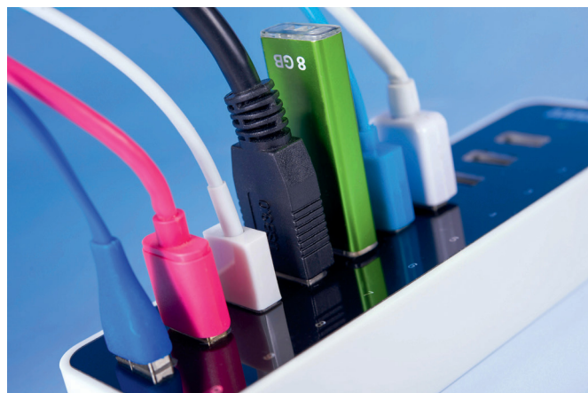
Buntes Angebot: Die KZVB bietet vielfältige digitale Dienstleistungen an.

Seit 2017 gibt es im internen Bereich von kzvb.de neben der Online-Bestellung des elektronischen Praxisausweises vor allem das Servicecenter. Hier können Zahnärzte die Anschaffungspauschalen für die Anbindung an die Telematikinfrastruktur (TI) beantragen. Ein Blick ins Servicecenter lohnt sich aber auch allein schon deshalb, weil Vertragszahnärzte in dem dort bereitgestellten Refinanzierungs-