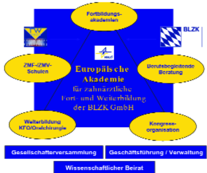
Grafiken: eazf GmbH

Ungeachtet der ungünstigen Rahmenbedingungen wurden in den nunmehr fast achtzehn Monaten seit der Gründung Kooperationen mit privaten und wissenschaftlichen Organisationen sowie Hochschulen weiter ausgebaut. Hierbei wurden auch einige Kontakte zum Ausland geknüpft, deren Umsetzung in konkrete Projekte bis Ende 2006 terminiert ist. Neben etablierten Kursinhalten und den bestehenden Curricula im Bereich Implantologie, Parodontologie und Kinderzahnheilkunde wurden neue Einzelkurse und Kursserien in das Programm aufgenommen. Exemplarisch seien hier die Kompaktkurse Alterszahnmedizin und Endodontie genannt. In Vorbereitung ist zudem ein umfassendes Curriculum zur Ästhetischen Zahnmedizin sowie ein auf der Weiterbildungsordnung basierendes Angebot für Weiterbildungsassistenten der Oralchirurgie.