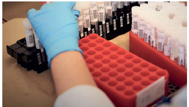
Abb. 3: Eine Laboranalyse zeigt einen erhöhten Interleukin-6-Blutspiegel bei Parodontitis. Ein erhöhter IL-6-Blutspiegel ist auch ein Risikofaktor für einen schweren Covid-19-Verlauf.