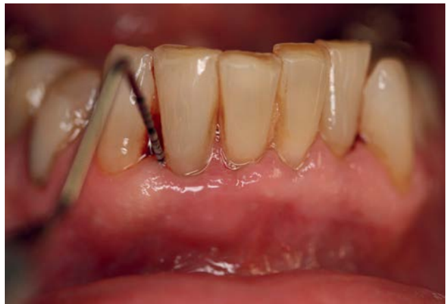
Abb. 1: Risikofaktoren assoziiert mit einem schweren Covid-19-Verlauf und Parodontitis

Risikofaktoren auch mit Parodontitis assoziiert