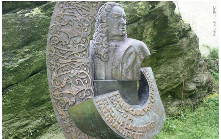
Hans Carl von Carlowitz, Oberberghauptmann und Forstwirtschaftsexperte aus Sachsen, prägte bereits im 18. Jahrhundert den Begriff der Nachhaltigkeit.

Damals stand es schlecht um den deutschen Wald. Holz war Energiequelle und Rohstoff Nummer eins. Erzgruben und Schmelzhütten gingen ihm an die Substanz. Jahrhundertlang hatte man